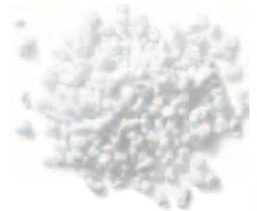
Perlite, hergestellt aus natürlichem Vulkangestein, ist die Basis für TecTem® Climaprotect.

KNAUF AQUAPANEL ist der namhafte Hersteller natürlicher Dämmstoffe, die auf dem Vulkangestein Perlit basieren, und Partner führender Schimmelpilzexperten. Gemeinsam mit ihnen hat KNAUF AQUAPANEL ein innovatives System zur Sanierung entwickelt, das dem Schimmel verlässlich ein Ende setzt!