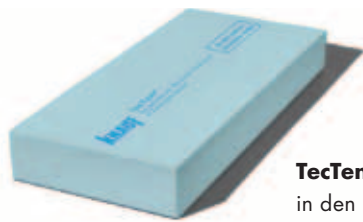
TecTem® Insulation Board Indoor Climaprotect in den Dicken 25 mm und 30 mm

TecTem® Climaprotect ist Feuchtregulierung und Wärmedämmung in einem und dabei resistent gegen Schimmel. Mit den optimal aufeinander abgestimmten Komponenten ist es die sichere Lösung für einen gesunden Wohnraum durch kompromisslosen Schimmelpilzschutz und eine leichte Verarbeitung. Das System besteht aus: