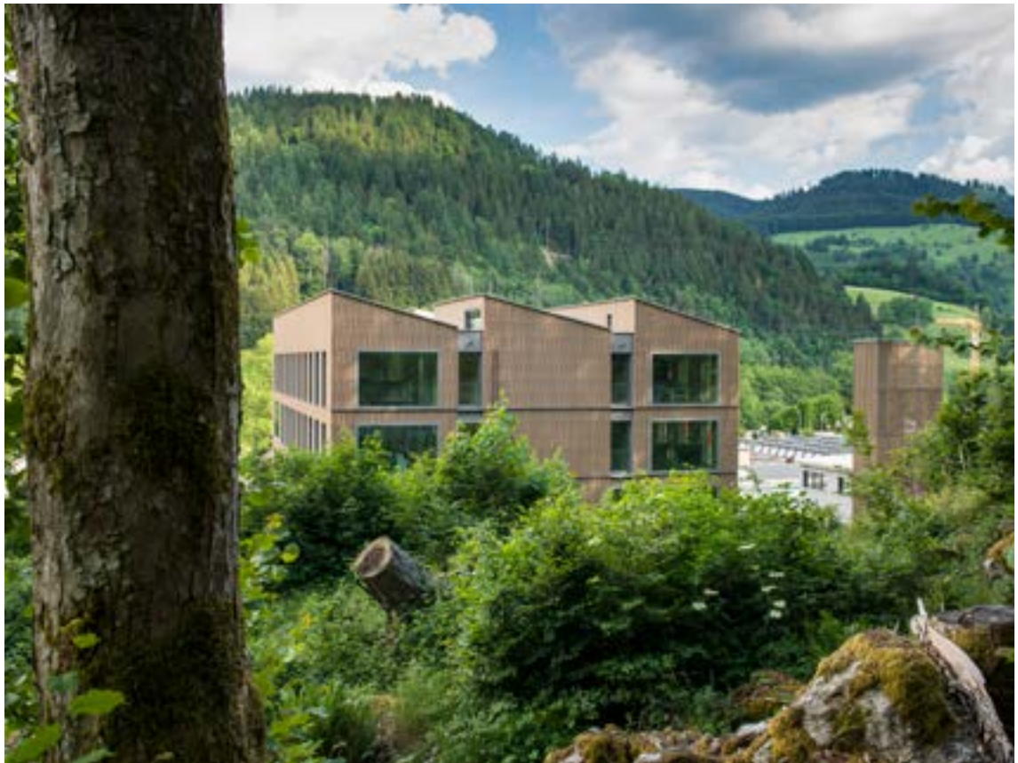
Bild rechts: Naturnähe und Transparenz: In Schönau realisierte das Architekturbüro Harter + Kanzler & Partner einen mehrgeschossigen Büro- neubau aus konfigurierbaren Brettspertholzbauteilen made of Ligno für Wände, Decken und Dach.