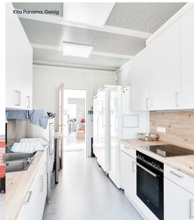
Kita Panama, Geisig