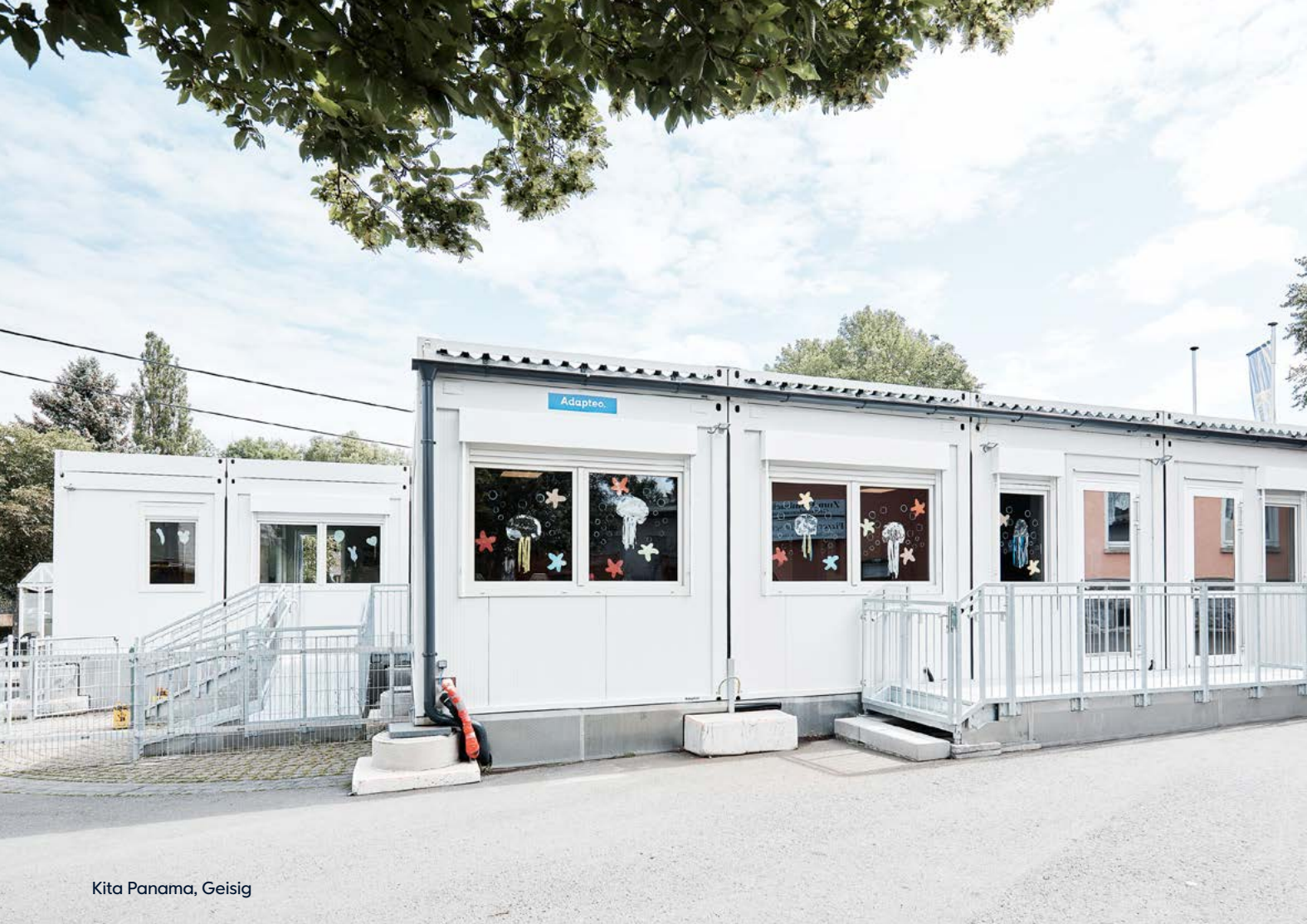
Kita Panama, Geisig