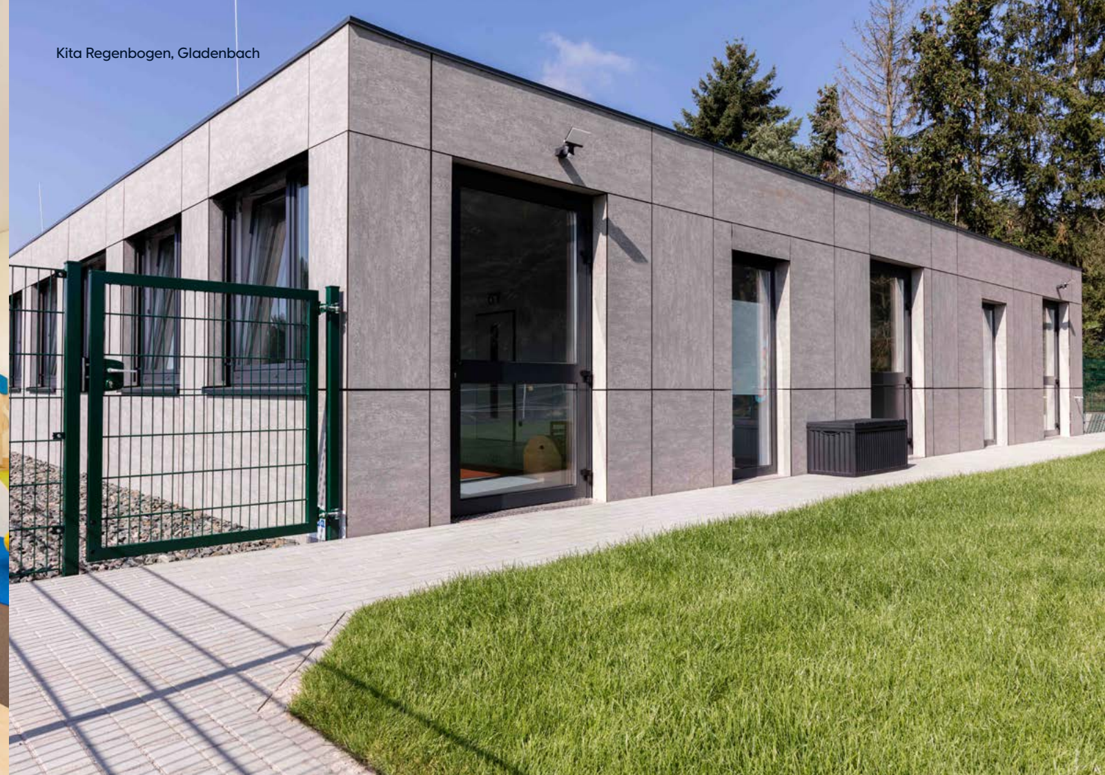
Kita Regenbogen, Gladenbach