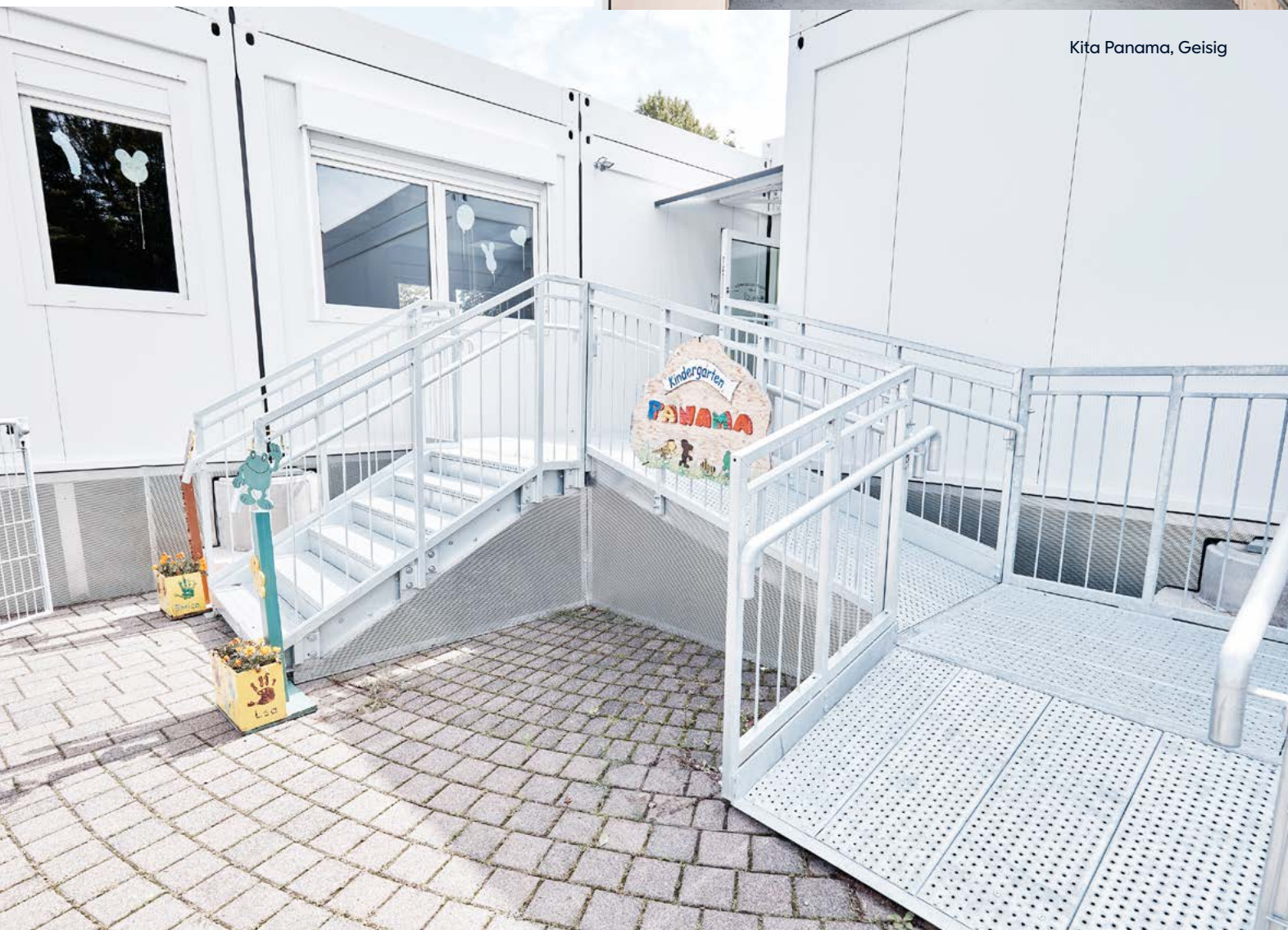
Kita Panama, Geisig