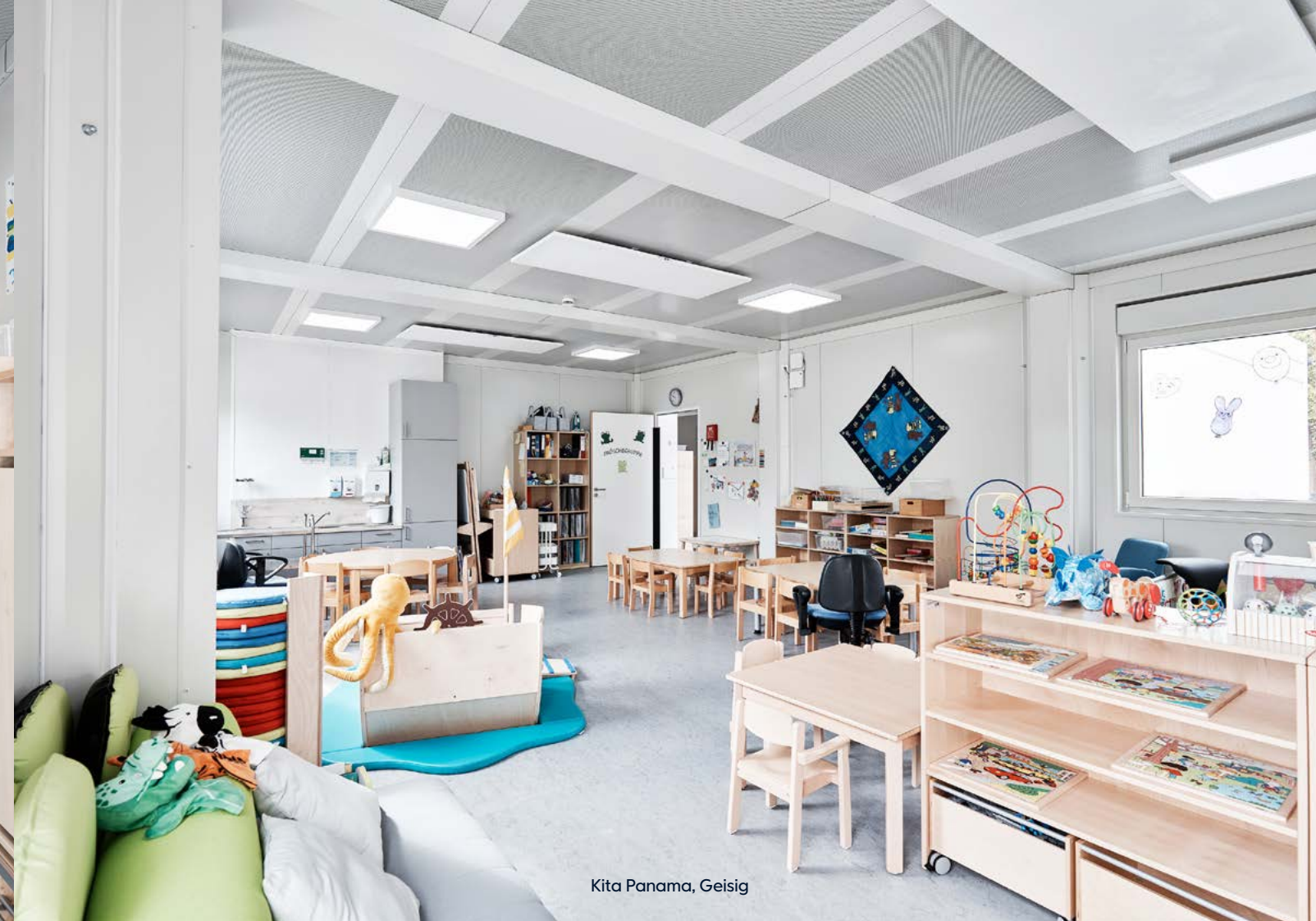
Kita Panama, Geisig