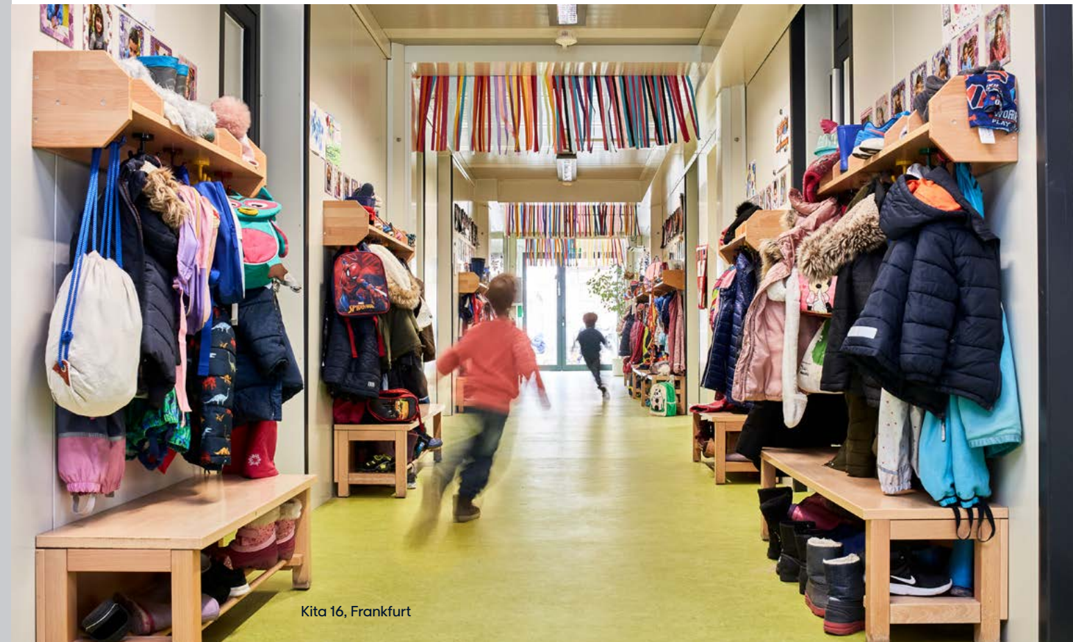
Kita 16, Frankfurt