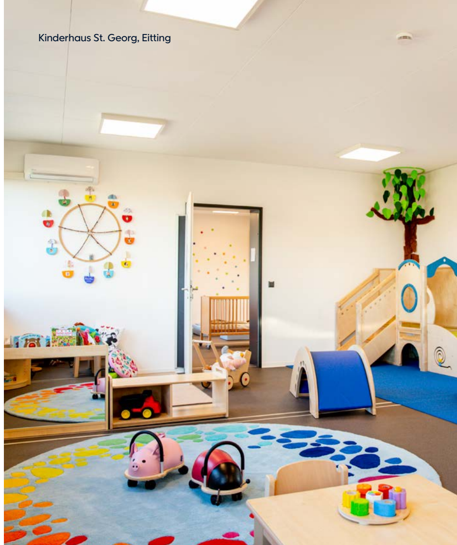
Kinderhaus St. Georg, Eitting