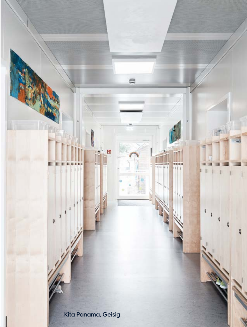
Kita Panama, Geisig

Vario Plus bietet mehr Komfort, mehr Ausstattung und mehr Möglichkeiten bei voller modularer Flexibilität. Die Fotos zeigen wie vielseitig und hochwertig temporäre Kitagebäude heute sein können – funktional geplant, durchdacht ausgestattet und bereit für den echten Alltag.