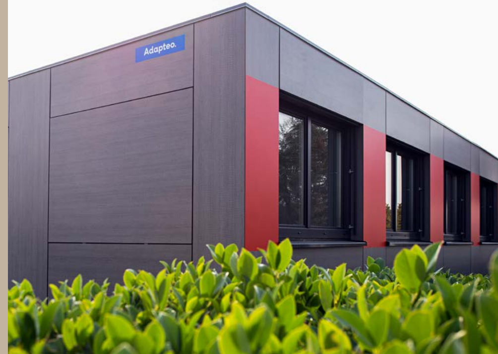
Kita Hoppe, Sprockhövel