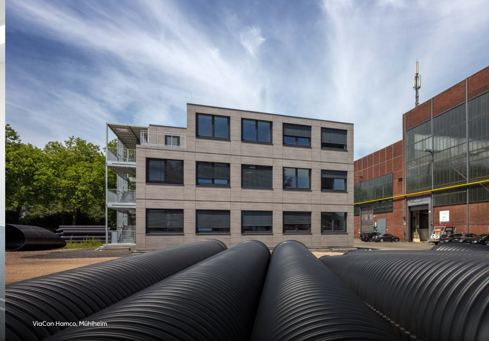
ViaCon Hamco, Mühlheim