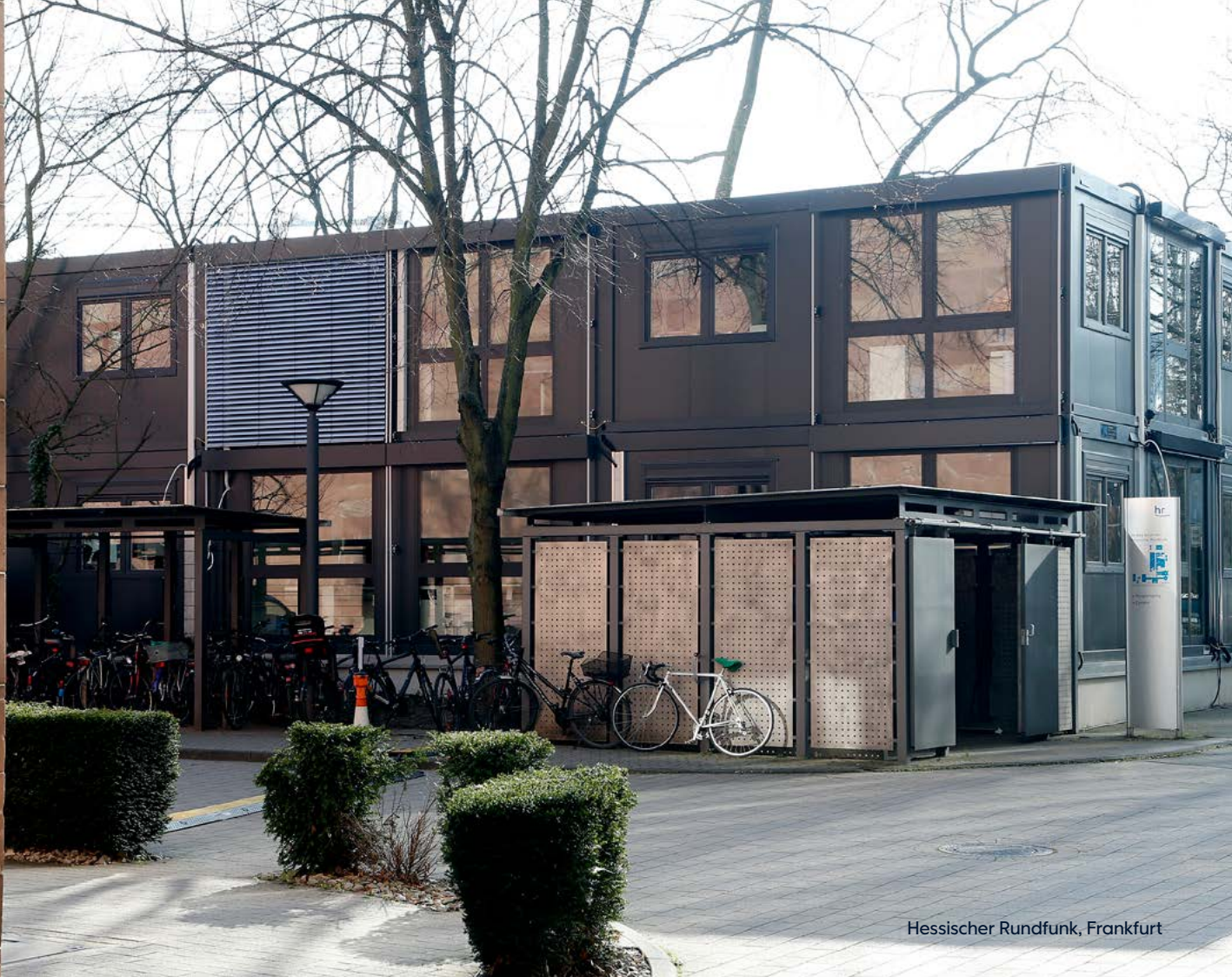
Hessischer Rundfunk, Frankfurt