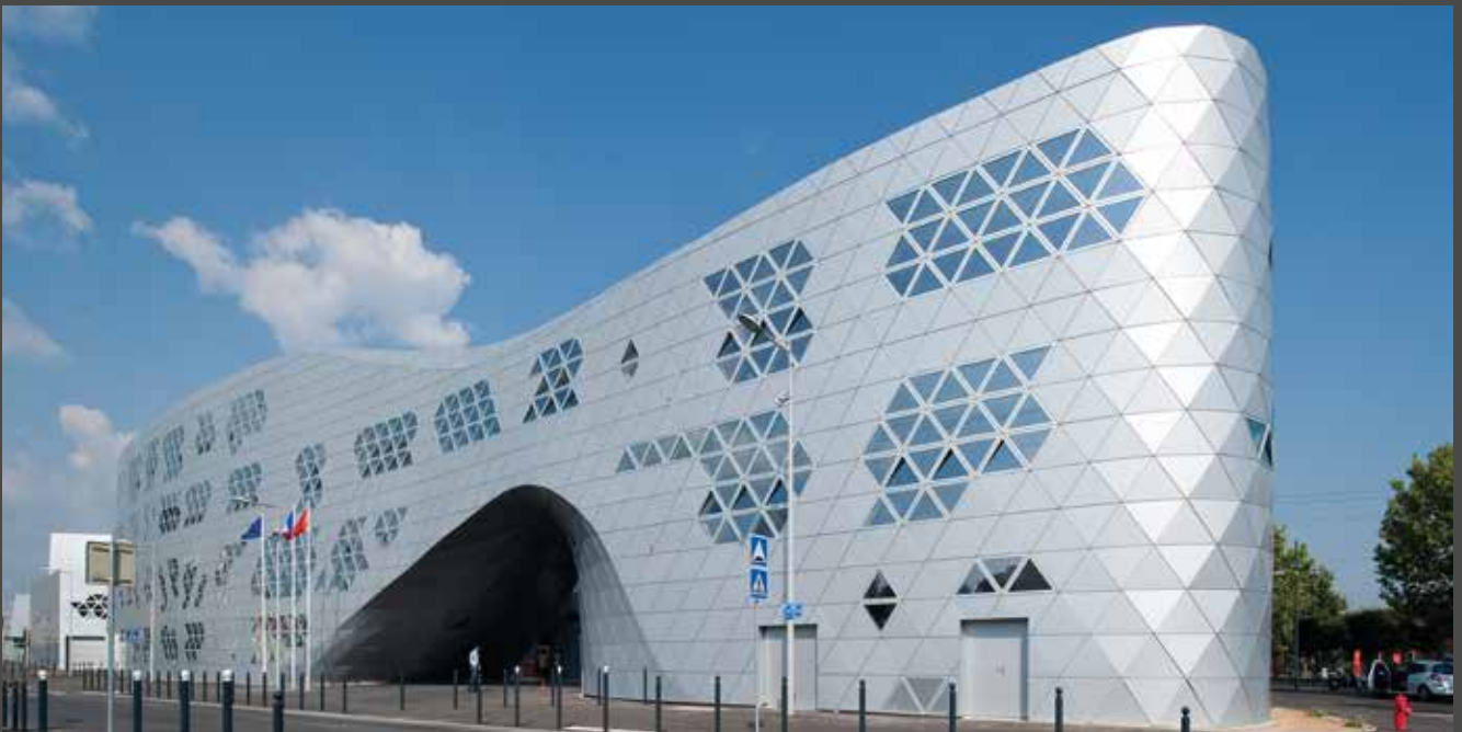
Lycée Georges Frêche, France | Architect: Massimiliano and Doriana Fuksas, Rome, Paris | Fabricator: Tim Composites, SMAC Toulouse Material: ALUCOBOND® anodized look C0/EV1

Die Verwendung hochwertiger Fluorpolymer-Lacksysteme, die in einem kontinuierlichen Lackierverfahren (coil coating) appliziert werden, garantiert die kompromisslose Verwirklichung des ursprünglichen Designs.