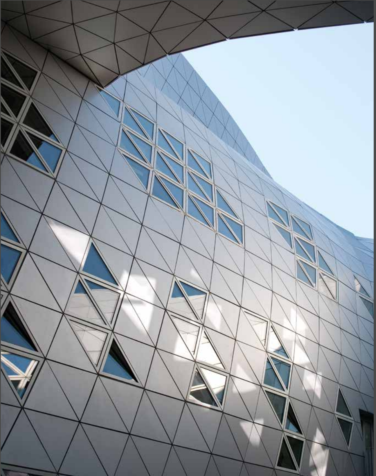
Lycée Georges Frêche, Frankreich | Architekt: Massimiliano und Doriana Fuksas, Rom, Paris | Verarbeiter: Tim Composites, SMAC Toulouse Material: ALUCOBOND® anodized look C0/EV1