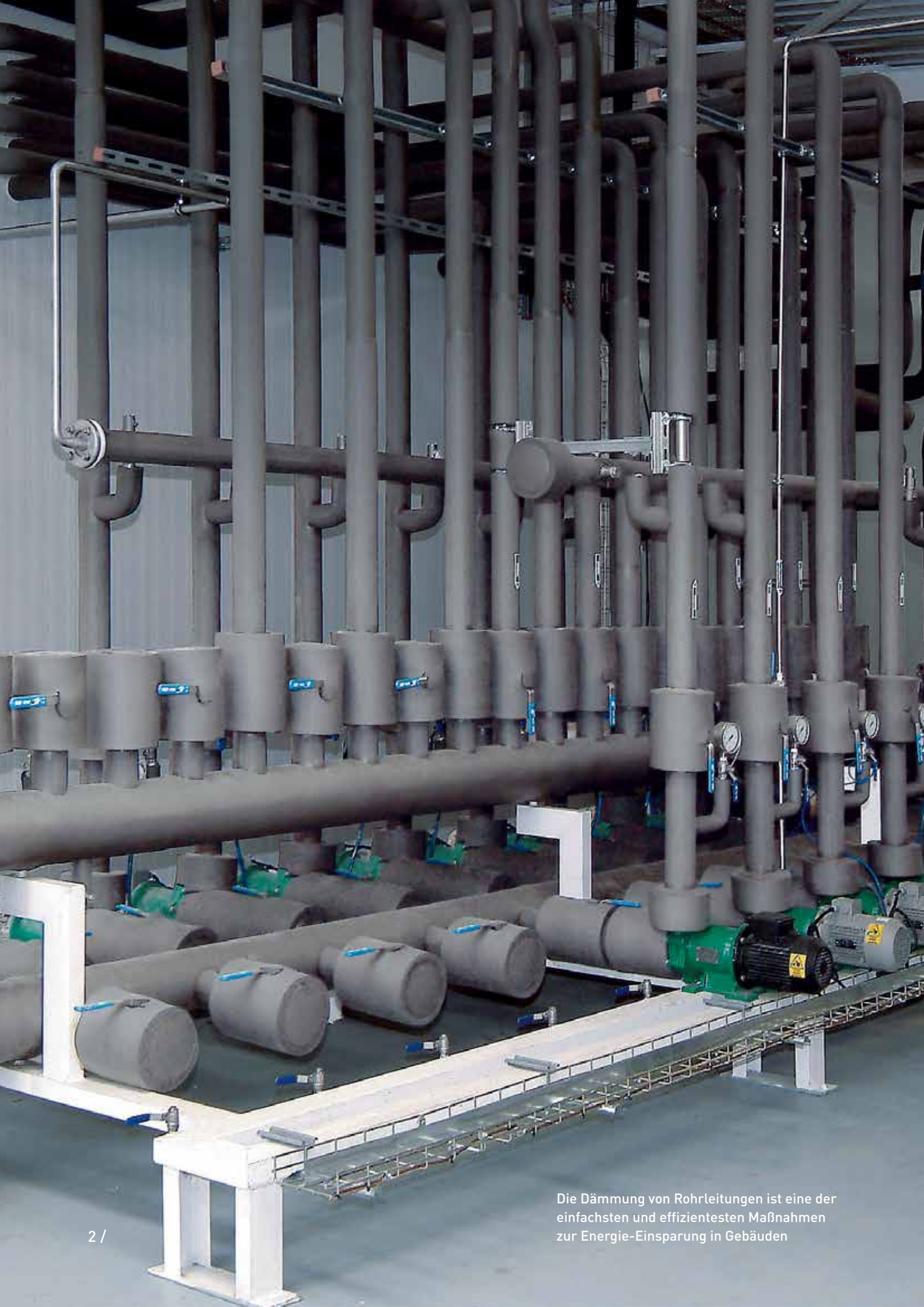
Die Dämmung von Rohrleitungen ist eine der einfachsten und effizientesten Maßnahmen zur Energie-Einsparung in Gebäuden