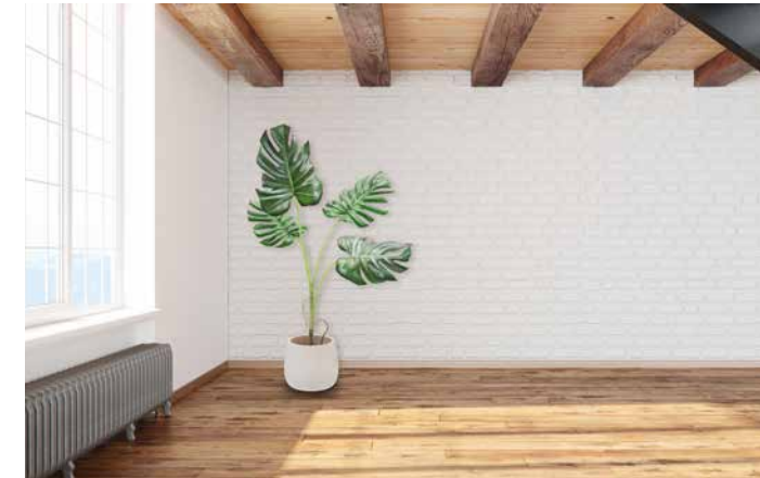
Rustikale Decke mit Douglasie Naturholzplatten

Bei Einsatz der Naturholzplatten vita für tragende Anwendung können die charakteristischen Werte für die Berechnung und Bemessung von Holzbauwerken der EN 12369:2008 Teil 3 entnommen werden.