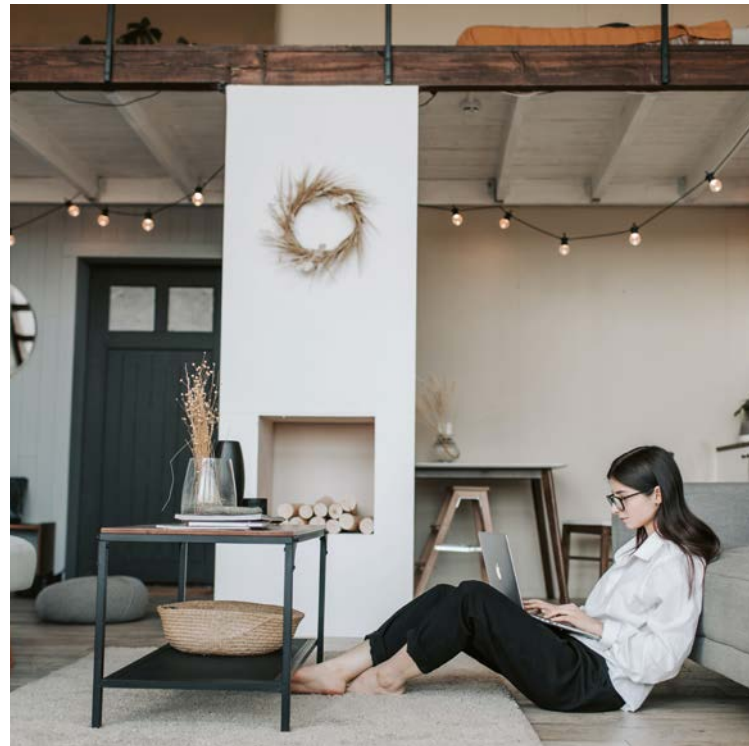
vita grundiert im Deckenbereich