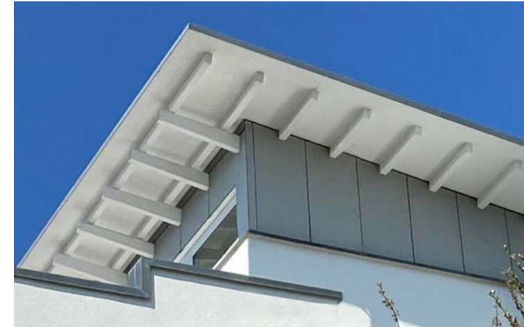
vita grundiert im witterungsgeschützten Dachvorstand

Ergänzt wird vita grundiert mit einem umfangreichen Gesamtsortiment an weiteren emissionsarmen Holzwerkstoffplatten. Damit fällt einem in den eigenen vier Wänden garantiert nicht die Decke auf den Kopf!