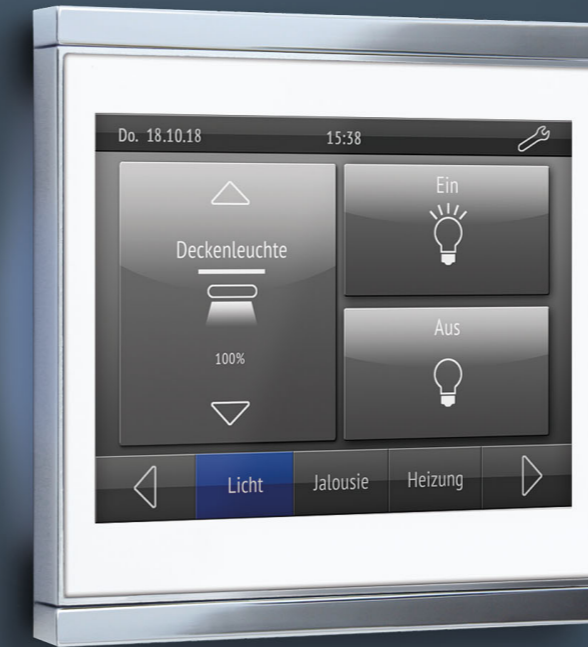
Corlo Touch KNX