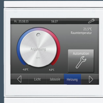
Corlo Touch KNX, weiß/weiß matt