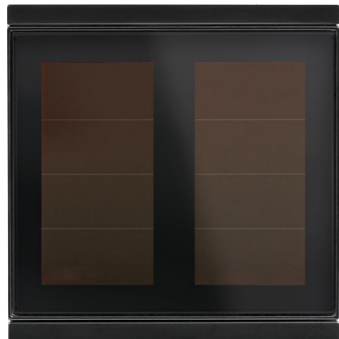
Corlo P1 RF Einfach-Solartaster, schwarz/schwarz matt