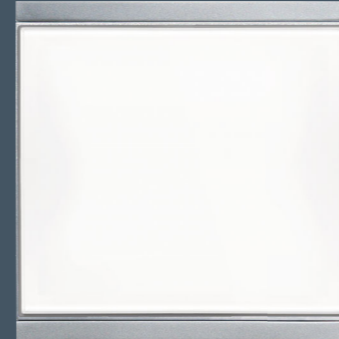
Corlo M1-T Einfach-Taster, weiß/Chrom matt