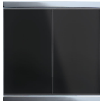
Corlo M1-T Einfach-Taster, schwarz/Chrom glanz