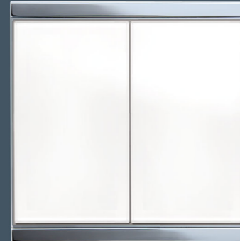
Corlo M2-T Doppel-Taster, weiß/Chrom glanz