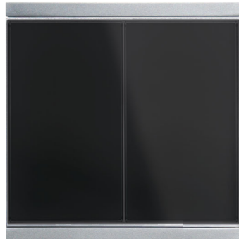
Corlo M2-T Doppel-Taster, schwarz/Chrom matt