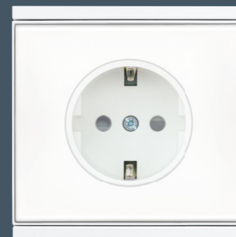
Corlo Steckdose, weiß/weiß matt