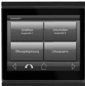
Corlo Touch KNX WL, schwarz/schwarz matt