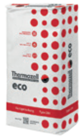
eco 250 Fertigmischung