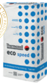
eco 400 speed Hochleistungs- Fertigmischung