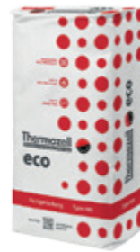
eco 400 Fertigmischung