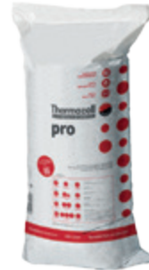
pro Veredeltes Granulat