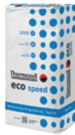
eco 250 speed Hochleistungs- Fertigmischung