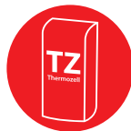
Thermozell pro / pro speed