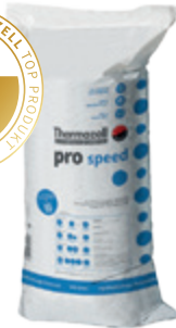
pro speed Veredeltes Hochleistungsgranulat