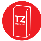
Thermozell eco / eco speed