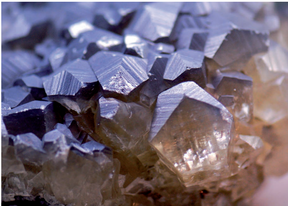
Quarz – der Grundstoff für das silikatische Bindemittel „Wasserglas“ oder „Kaliumsilikat“