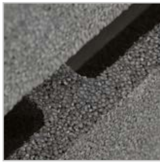
EPP-Polypropylen hat effektive Dämmeigenschaften