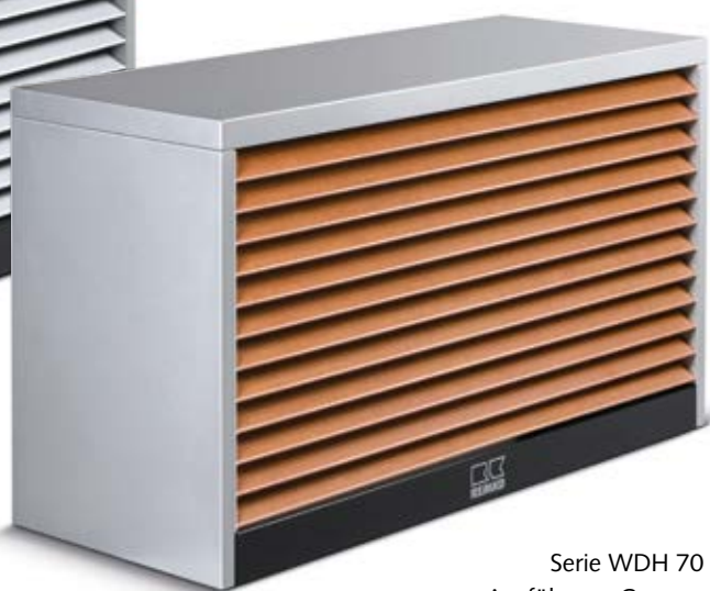
Serie WDH 70 Ausführung Camura