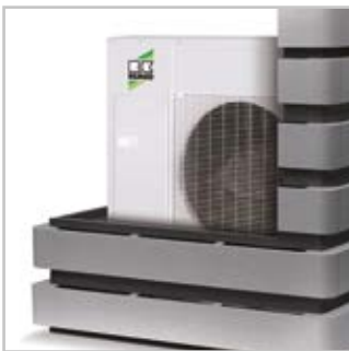
Schallreduktion von bis zu 15 dB(A)