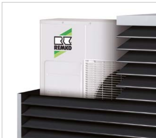
Querschnitt der Designhaube mit Blick auf das Außenmodul