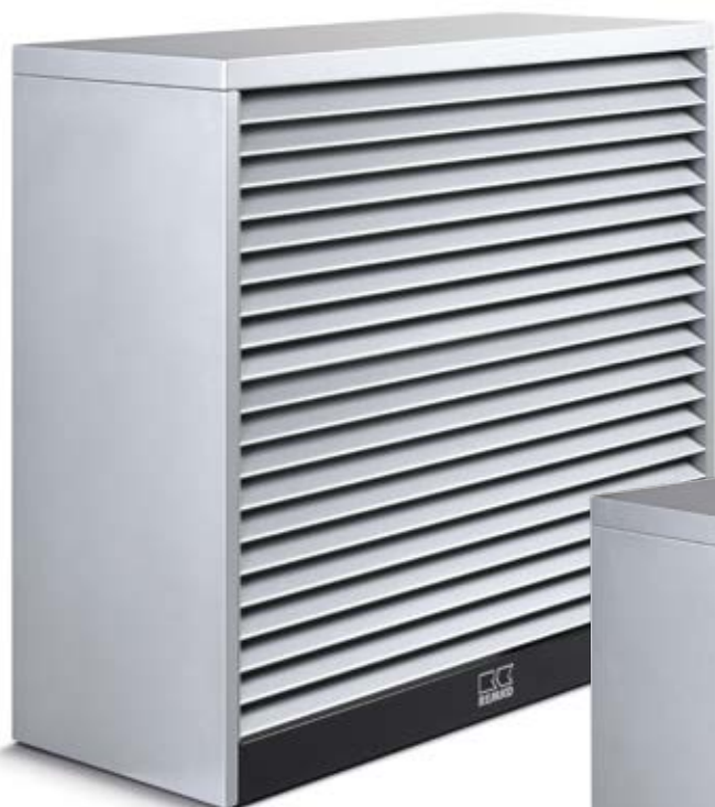
Serie WDH 120 Ausführung Alu