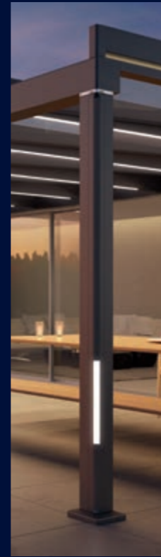
LED-Beleuchtung im Pfosten unten