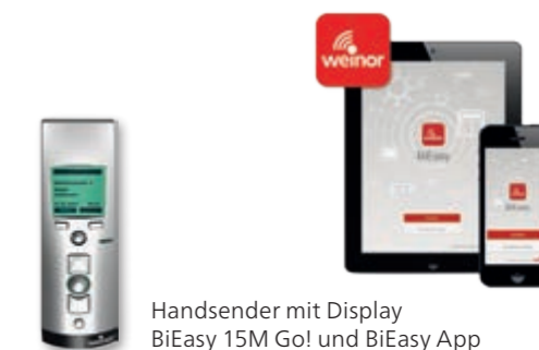
Handsender mit Display BiEasy 15M Go! und BiEasy App

Mit den Heizsystemen Tempura und Tempura Quadra können Sie Ihre Terrasse auch in kühleren Zeiten genießen. Sie sind nachrüstbar und werden unauffällig an der Hausfassade befestigt.