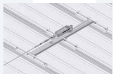
Endhalter Fangstoßdämpfung mit Feder- spannkraftanzeige (ca. 0,75 kN) und Indikatorklemme