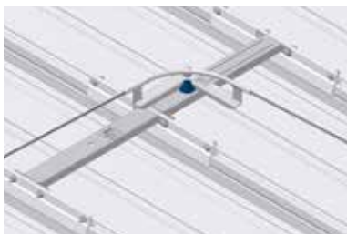
Eckumfahrung 90° verwendbar als Innenecke, Außenecke und Hochkantecke

Seilsicherungssysteme bieten einen hohen Arbeitskomfort. Die Person kann sich mit der persönlichen Schutzausrüstung an jeder beliebigen Stelle einklinken. Mittels frei überfahrbarer Zwischenhalter und Eckumfahrungen genießt der Anwender höchste Bewegungsfreiheit. Die Berufsgenossenschaft der Bauwirtschaft empfiehlt daher, Seilsysteme mehreren Einzelanschlagpunkten vorzuziehen.