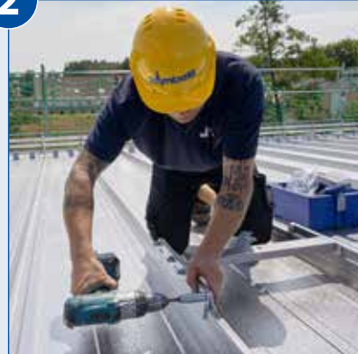
Anschlagpunkt am Profil einrasten und Schrauben leicht anziehen