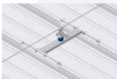
Zwischenhalter Bewegliche Seilzwischenhalterung ca. 220° (dadurch beidseitig begehbar) und Edelstahldrahtseil 8 mm