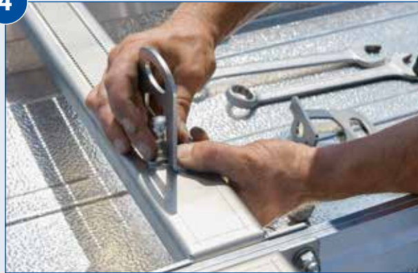
Anschlagöse am Grundkörper montieren