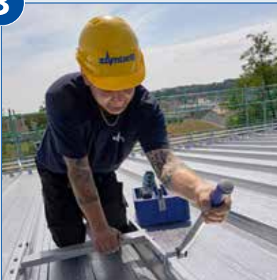
Vorgegebenes Drehmoment aufbringen