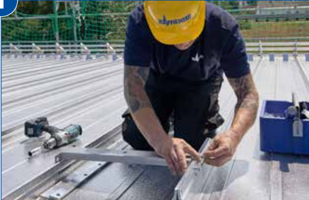
Vormontage der Klemmbacken am Grundkörper