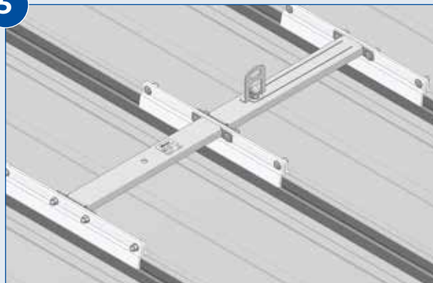
Fertig montierte Anschlagpunkte