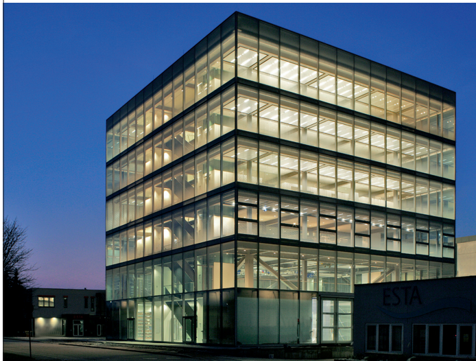
Montage- und Verwaltungszentrum ESTA von gerken.architekten+ingenieure